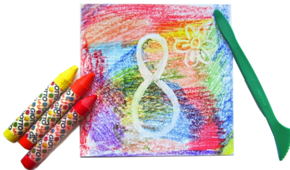
Пример работы восковыми мелками на глянцевом картоне с процарапыванием стеклом для детей старше 3-х лет

Раннее развитие не предполагает изучение методов и приемов рисования. Пока это пробы, которые должны доставлять ребенку удовольствие и расширять его навыки и кругозор. Дайте ребенку возможность постучать, повыводить каракули, поиграть, посмотреть какой след оставляет тот или иной цвет, как материал ведет себя на разных поверхностях. Таким образом у ребенка формируется понимание предметов и возможностей их использования, а в дальнейшем он сам обратится к вам с интересными идеями, которые вы сможете ему воплотить в жизнь.